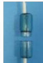
Рис. Б. Аромокапсула дифузора

Дифузор може використовуватися для кисневої ароматерапії. Для цього в ньому передбачена спеціальна розбірна аромокапсула (див. рис. Б). За необхідності в неї можна помістити губку, просочену ароматичною рідиною. Це допоможе зробити процедуру особливо приємною.